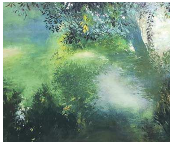
Canal junto al estanque .

20M.ES/CULTURA Lee este artículo y otras informaciones de cultura y entretenimiento en 20minutos.es