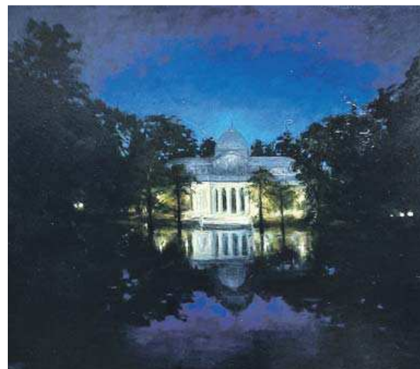
Palacio de Cristal a las 6 am .