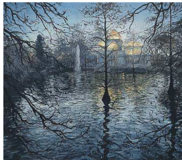
Palacio de Cristal al atardecer .