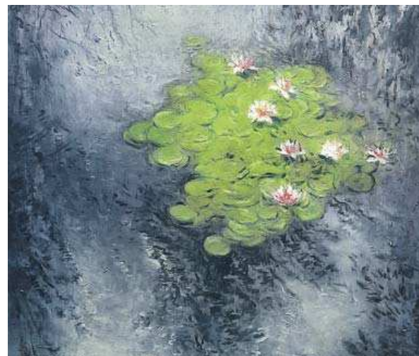
La obra llamada Charca de nenúfares .