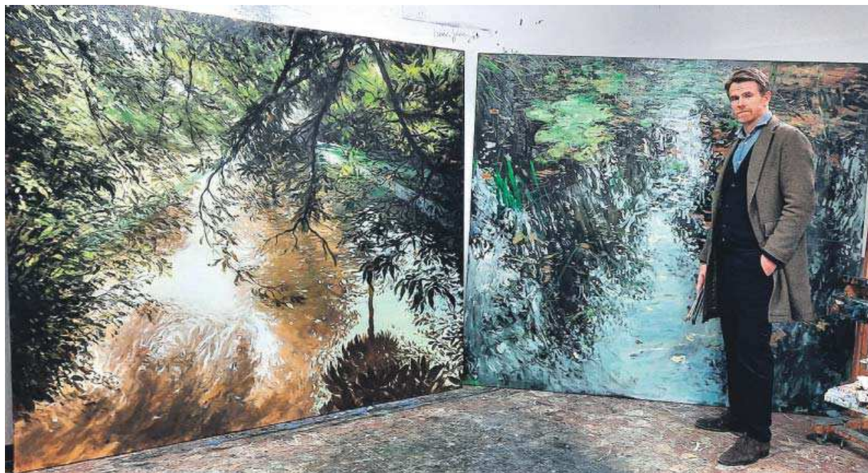
El pintor Tomás Baleztena posa junto a dos de sus obras, dos óleos dedicados a sendos canales.